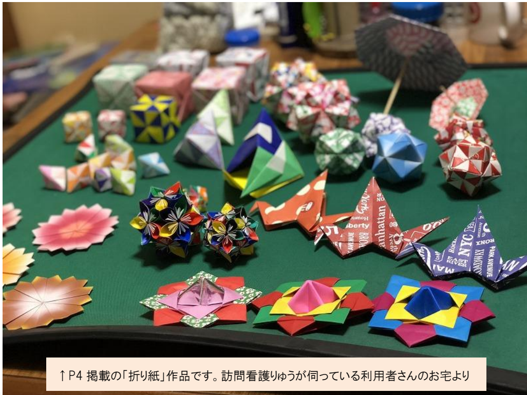
↑ P4 掲載の「折り紙」作品です。訪問看護りゆうが伺っている利用者さんのお宅より