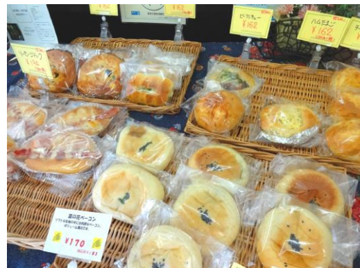
—焼きたてのおいしいパンがずら〜り！